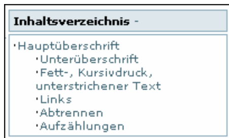
Abb.: Das Inhaltsverzeichnis der obigen Seite.

Die einzelnen Einträge des Inhaltsverzeichnisses können direkt angewählt werden.